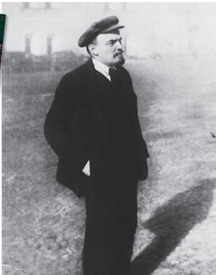
VÄGEN TILL REVOLUTIONEN. Catherine Merridale är en underhållande författare och hon framställer Lenin som en puritansk glädjedödare som sådde fröna till Stalins ohyggliga mordbedrifter.