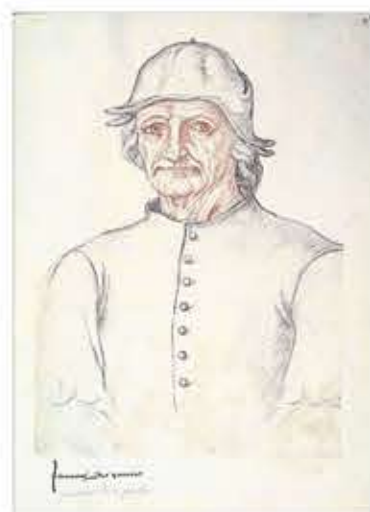
PORTRÄTT AV HIERONYMUS BOSCH. Jacques Le Boucq's porträtt av konstnären gjordes minst 30 år efter Boschs död.