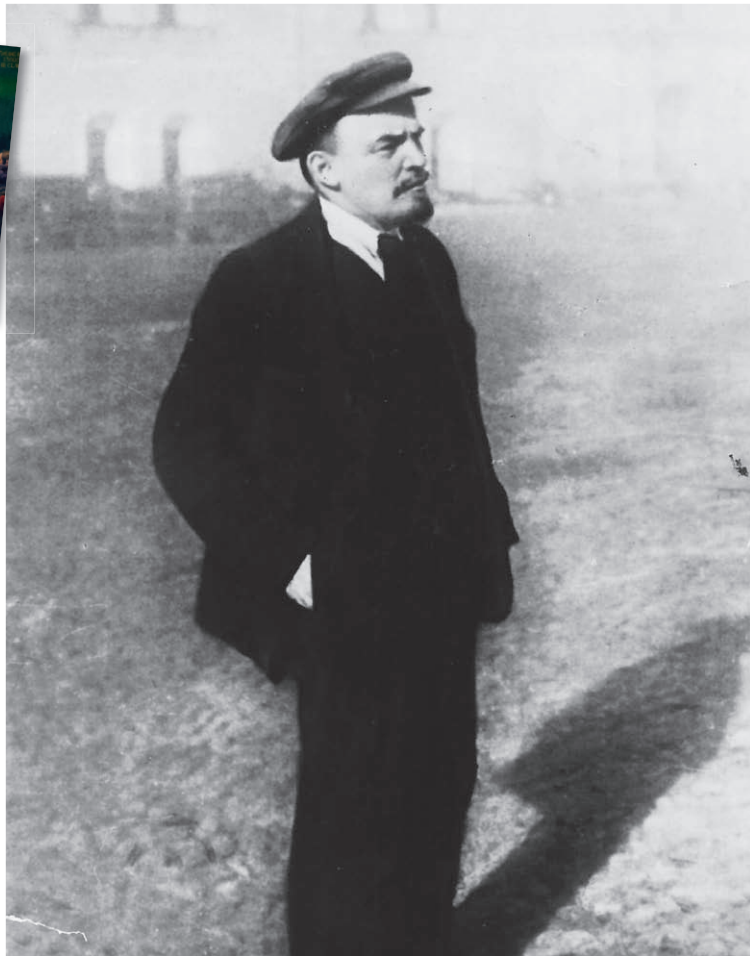
VÄGEN TILL REVOLUTIONEN. Catherine Merridale är en underhållande författare och hon framställer Lenin som en puritansk glädjedödare som sådde fröna till Stalins ohyggliga mordbedrifter.