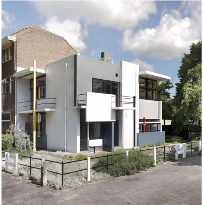
VÄRLDSARV. Gerrit Rietvelds villa, som han byggde åt den excentriska Truus Schröder-Schröder i Utrecht, är i dag klassad som världsarv. FOTO: IMAGE & COPYRIGHT. CENTRAL MUSEUM, UTRECHT/ ERNST MORITZ 2009-07

Men om man vill se många av Mondrians bästa målningar i